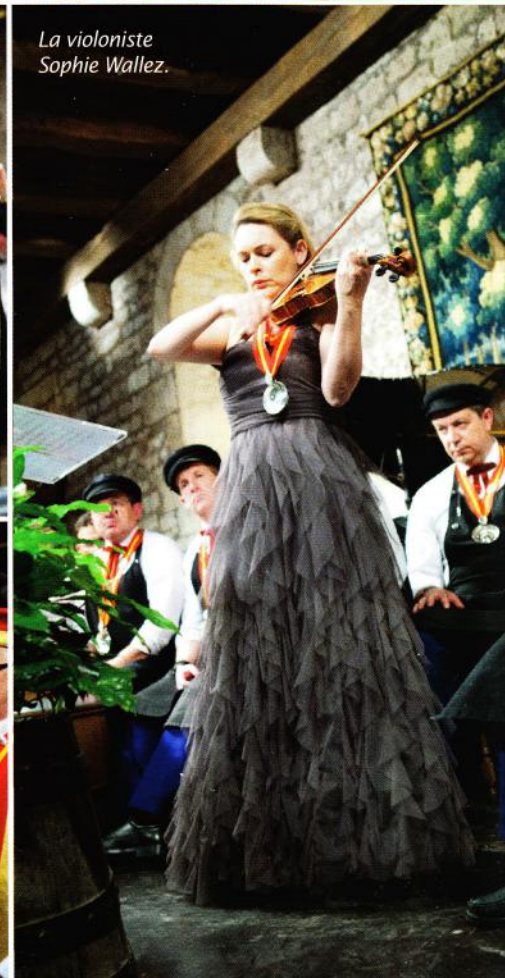
La violoniste Sophie Wallez.