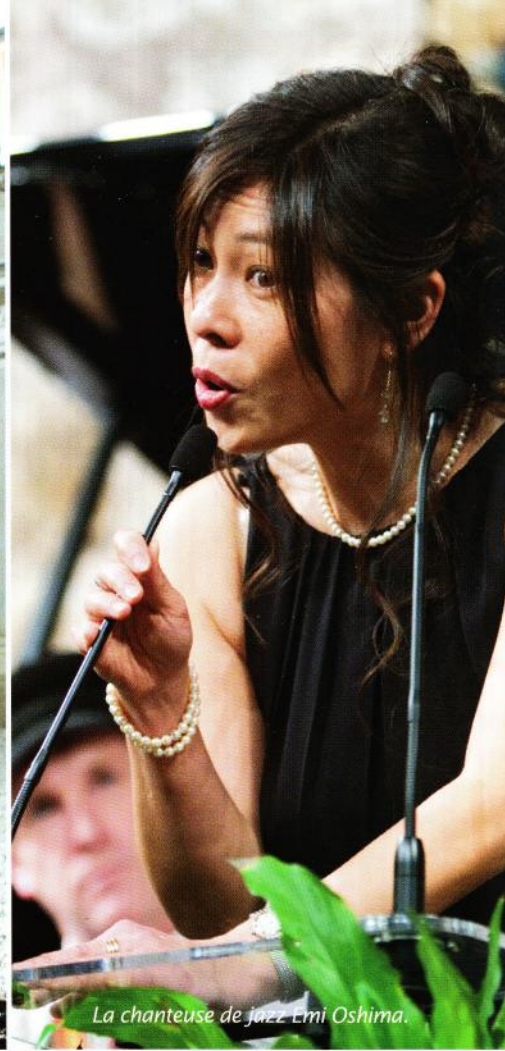
La chanteuse de jazz Emi Oshima.