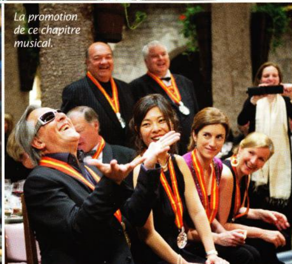
La promotion de ce chapitre musical.