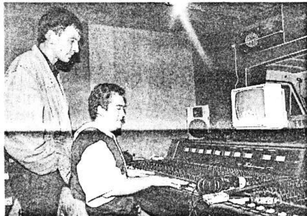
Les techniciens de Radio France effectuaient l'enregistrement.