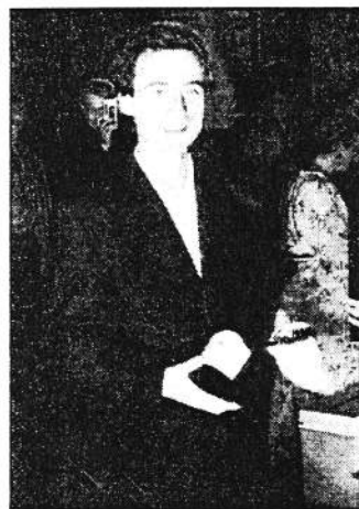
Le Domaine de la Bastide, partenaire, récompense le concertiste

Témoin ces Liszt ( ballade et rhapsodie hongroise ), Beethoven ( Appassionata ), Chopin ( andante et grande polonaise ) et Strauss en bis ( Chauve-Souris ). Soit autant de morceaux de bravoure qui, de-