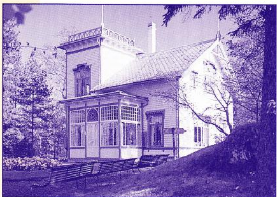
Troltsaugen (anno 1885)