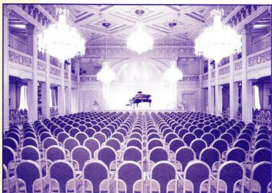
Store Sal i Den Gamle Logen

Takket være interessen som både våre samarbeidspartnere, sponsorer og kunstnere har vist for en helt spesiell konsertserie, blåser vi atter den internasjonale ånd inn i et kulturhus, som på Edvard Griegs tid ble omtalt «som arnestedet for høyere musikk». Den Gamle Logen er nok en gang i sitt rette element. Velkommen!