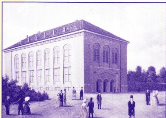
Den Gamle Logen (anno 1839)

1 1 . S E P T E M B E R - 1 1 . D E S E M B E R 1 9 9 3